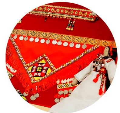
ИЗОБРАЗИТЕЛЬНОЕ И ДЕКОРАТИВНО-ПРИКЛАДНОЕ ТВОРЧЕСТВО, КОСТЮМЫ